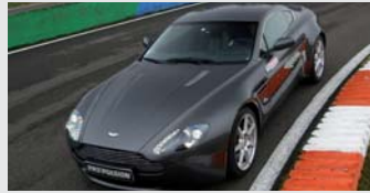
Aston Martin V8 de 4,7 litres 426 CV à 7300 tr/mn