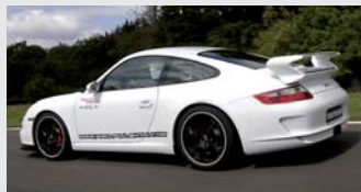
Porsche 997 GT3 Flat 6 de 3,6 litres 410 CV à 7800 tr/mn