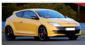
Megane RS type CUP

4 cylindres de 2 litres turbo 250 CV à 5500 tr/mn