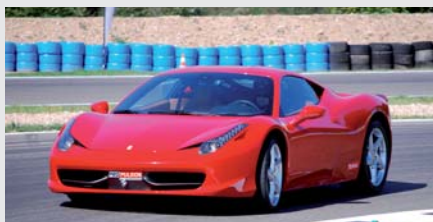
Ferrari F458 Italia

Audi R8, Aston Martin, Porsche 997 GT3 ou Nissan GTR