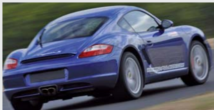
Porsche Cayman S

Porsche Cayman S + 3 GT au choix Audi R8, Aston Martin, Porsche 997 GT3 ou Nissan GTR