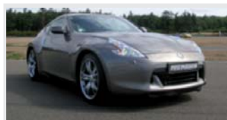
Nissan 370 Z