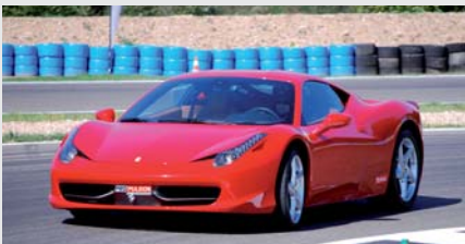
Ferrari F458 Italia

Audi R8, Aston Martin, Porsche 997 GT3 ou Nissan GTR