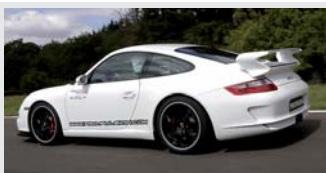
Porsche 997 GT3

Flat 6 de 3,6 litres 410 CV à 7800 tr/mn