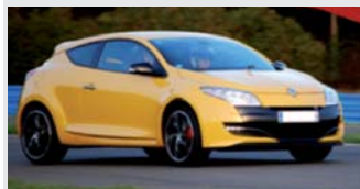
Megane RS type CUP

4 cylindres de 2 litres turbo 250 CV à 5500 tr/mn