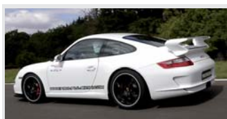
Porsche 997 GT3

Flat 6 de 3,6 litres 410 CV à 7800 tr/mn