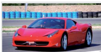
Ferrari F458 Italia