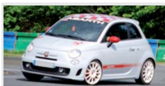
Fiat 500 ABARTH

Flat 6 de 3,4 litres 295 CV à 7000 tr/mn