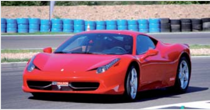
Ferrari F458 Italia

Audi R8, Aston Martin, Porsche 997 GT3 ou Nissan GTR