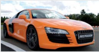
Audi R8 V8 de 4,2 litres 420 CV à 7800 tr/mn

Audi R8, Aston Martin, Porsche 997 GT3 ou Nissan GTR