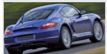
Porsche Cayman S

Flat 6 de 3,4 litres 295 CV à 7000 tr/mn