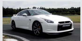
Nissan GTR 3,8 litres bi-turbo 480 CV