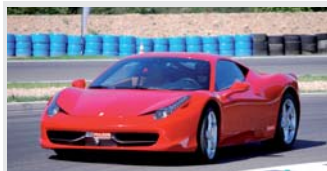
Ferrari F458 Italia