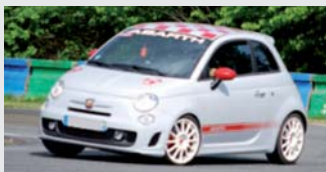
Fiat 500 ABARTH

Flat 6 de 3,4 litres 295 CV à 7000 tr/mn