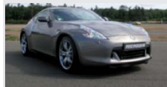
Nissan 370 Z